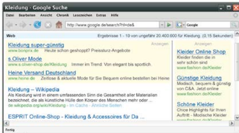
Im Gelb markierten Bereich sind die Google AdWords™ Anzeigen platziert

Google Adwords™ (Wortspiel auf englisch „Adverts“ = Werbeanzeigen und „Words“ = Worte) ist als Keyword-Advertising eine Form der Internetwerbung des Suchmaschinenbetreibers Google Inc.